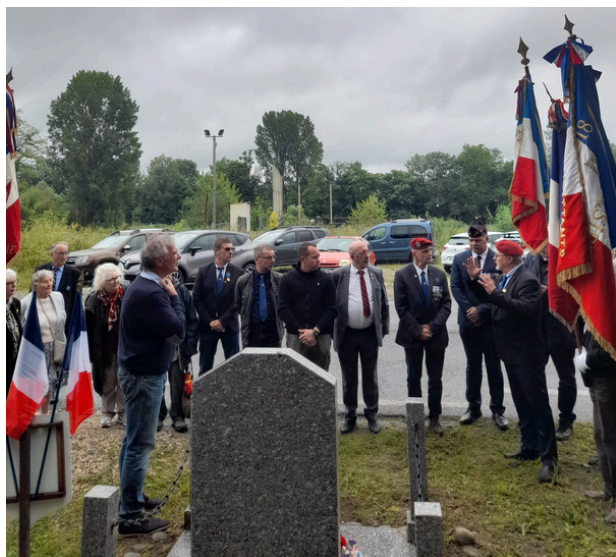
Dépôt de gerbe stèle de Salies le 7 juin 2025