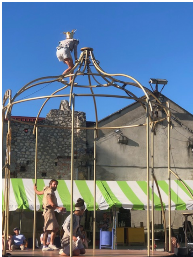
Spectacle de cirque Mon Royaume le jeudi 29 mai à l'Usineuse