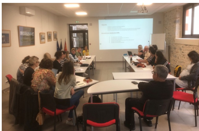
Réunion du Comité de pilotage du programme Mazères, Village d'avenir - création d'un Tiers-Lieux le mercredi 4 juin