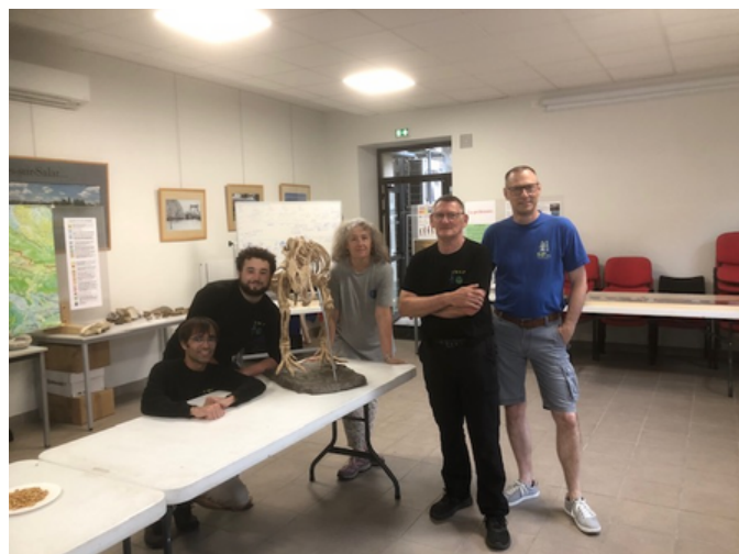
Exposition et conférence à la Mairie dans le cadre des Journées européennes de l'Archéologie les 13, 14 et 15 juin