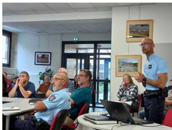
Réunion avec la gendarmerie le 7 juin 2025 pour la préparation de la fête locale