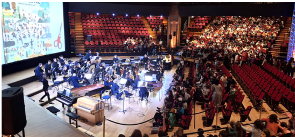
Puis nous avons pique-niqué au jardin des plantes.