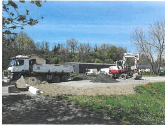
début du chantier du City park