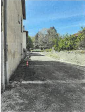
la rue du 1er Mai en travaux

Pendant les vacances scolaires de printemps, la rue du 1er Mai et une partie de la rue du Levant ont fait peau neuve. L'entreprise Colas a effectué des travaux de réfection de la chaussée qui était détériorée. L'entreprise a également commencé le terrassement pour l'implantation du city park.